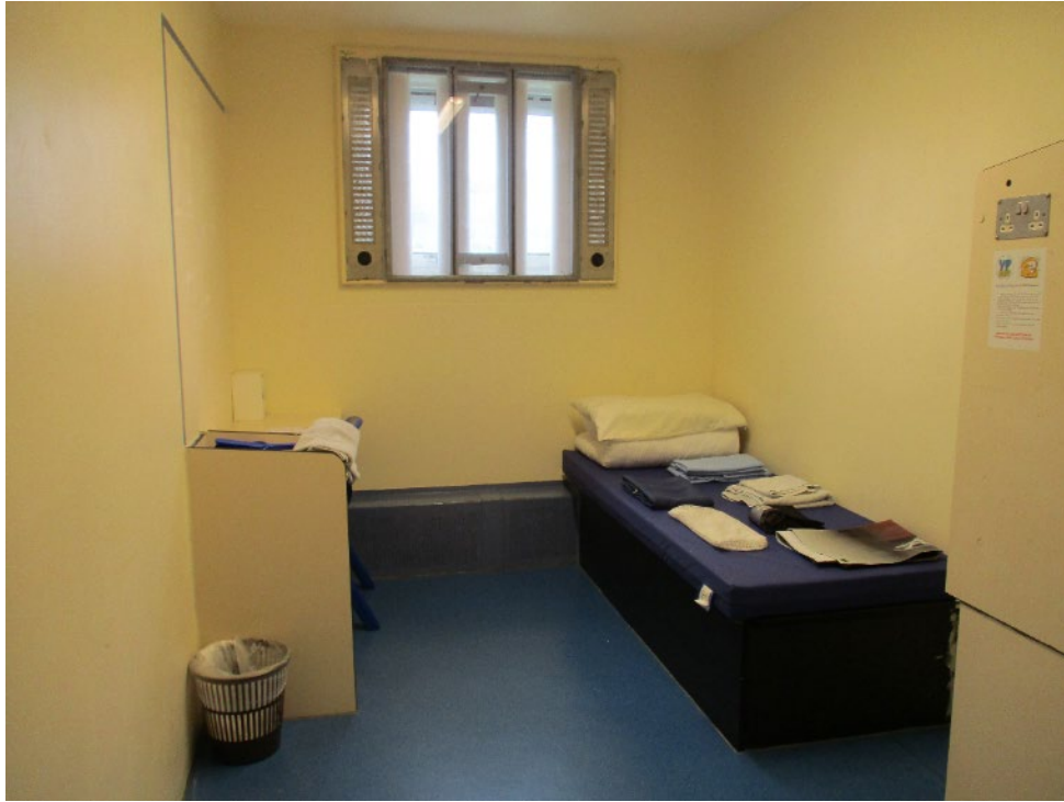
Cell wedi'i pharatoi ar gyfer newydd-ddyfodiad