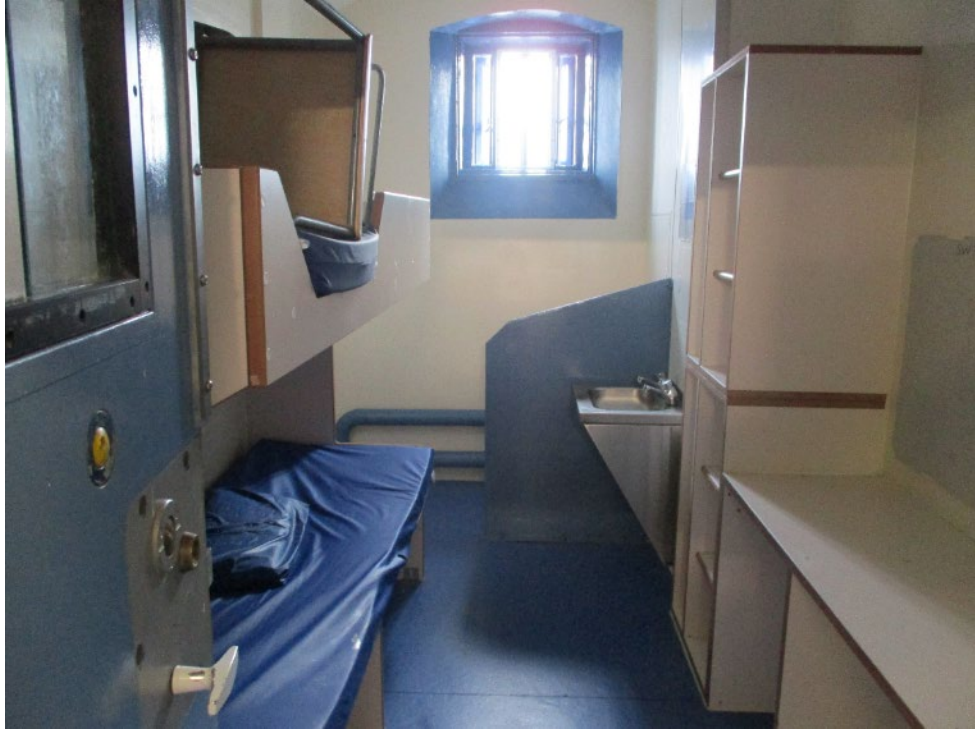
Cell gynefino sydd newydd gael ei pharatoi