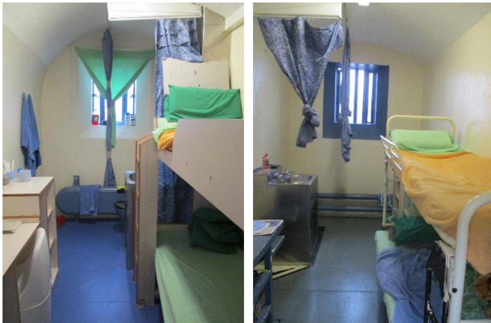
Celloedd ar adain D (chwith) ac adain A (dde)