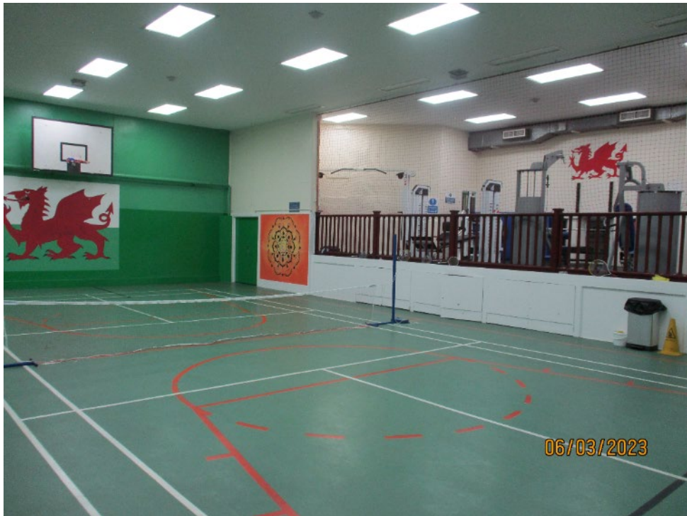
Yr hen gampfa