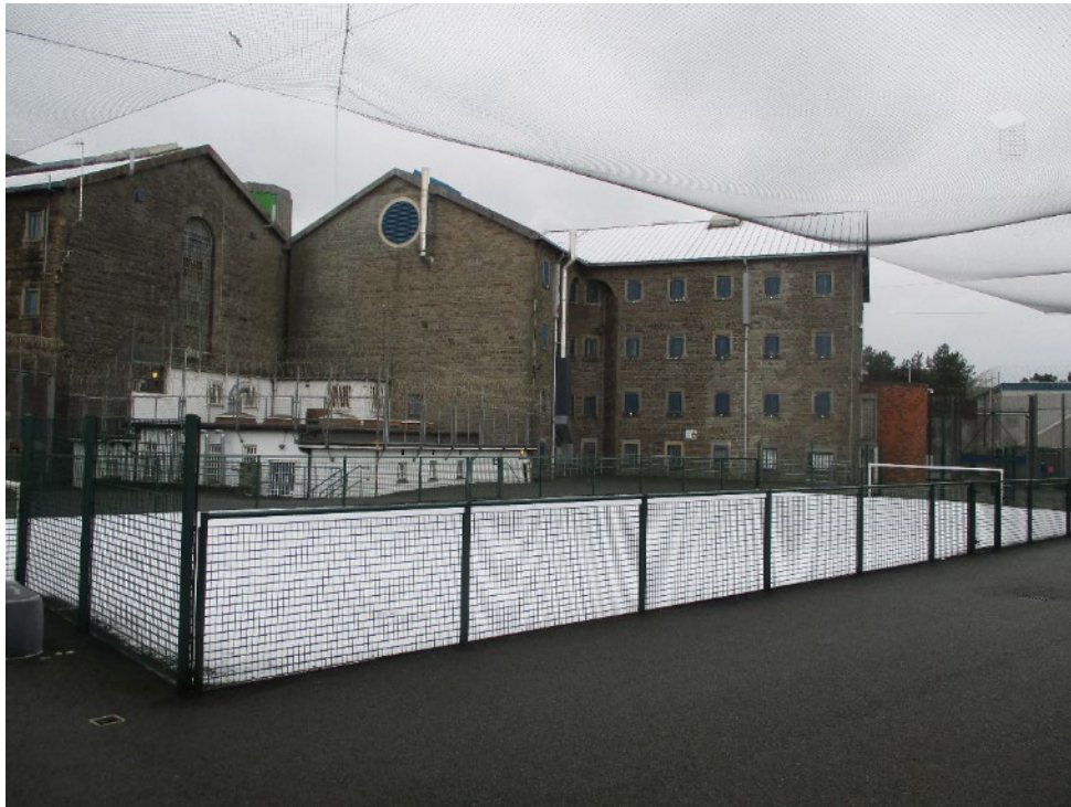
Iard ymarfer ADF