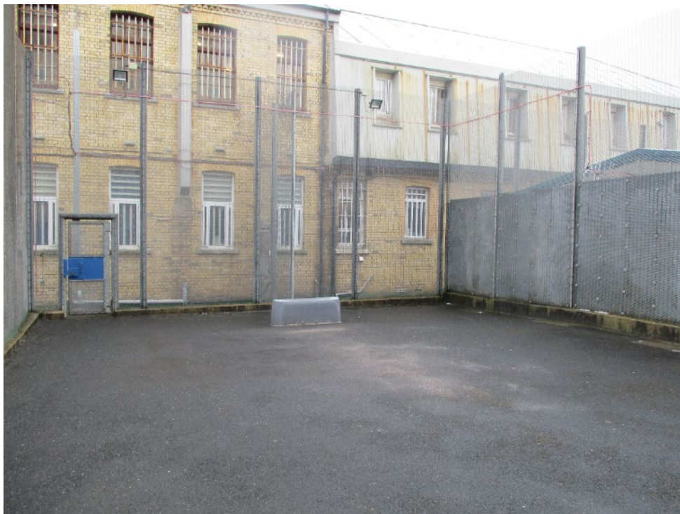
Iard ymarfer CEG