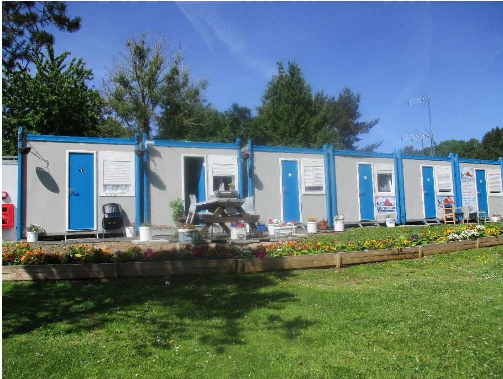
Podiau llety ym Mhrescoed