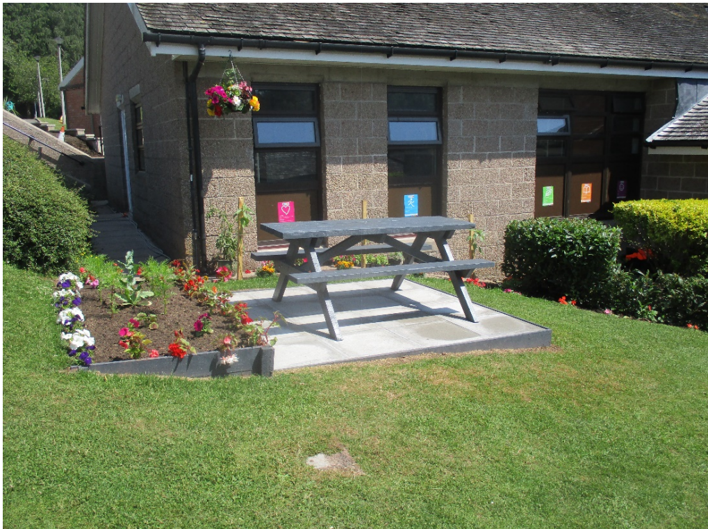
Gardd llesiant ym Mhrescoed