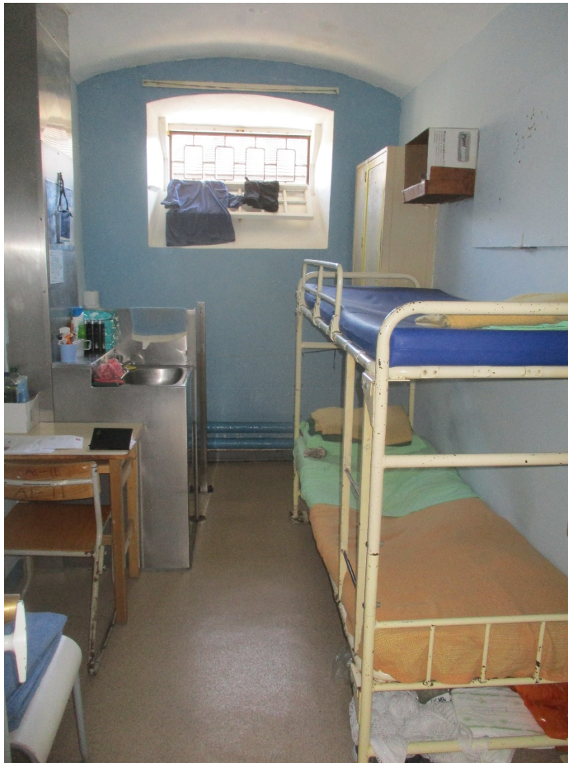
Cell ddwbl ym Mrynbuga