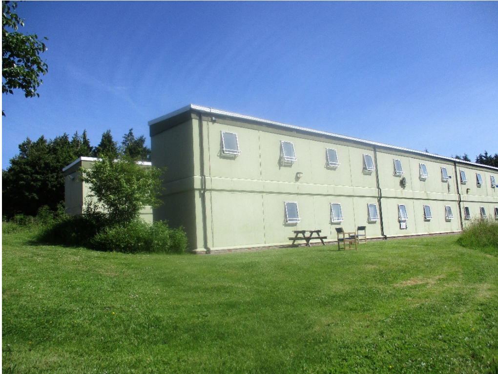
Uned Lester ym Mhrescoed