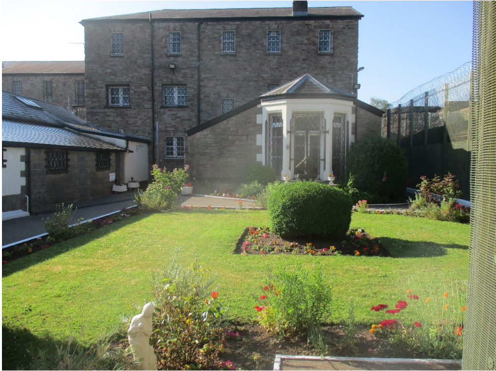
Gardd ym Mrynbuga