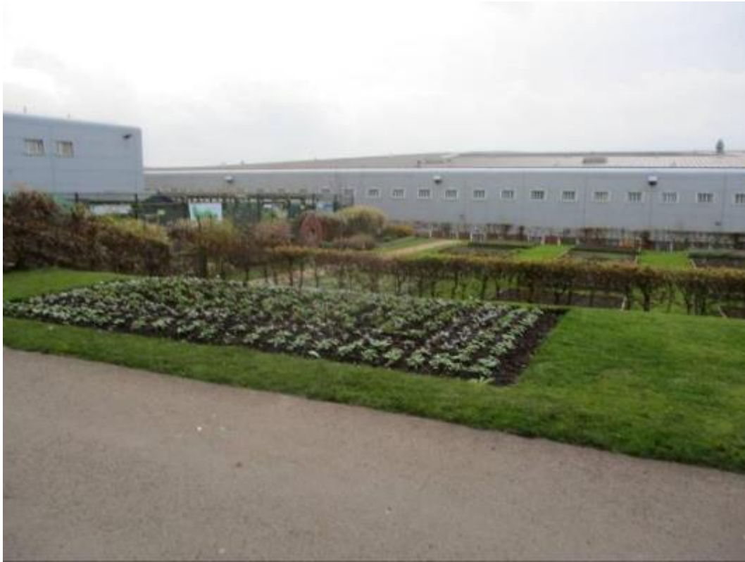
Gerddi canolig y carchar