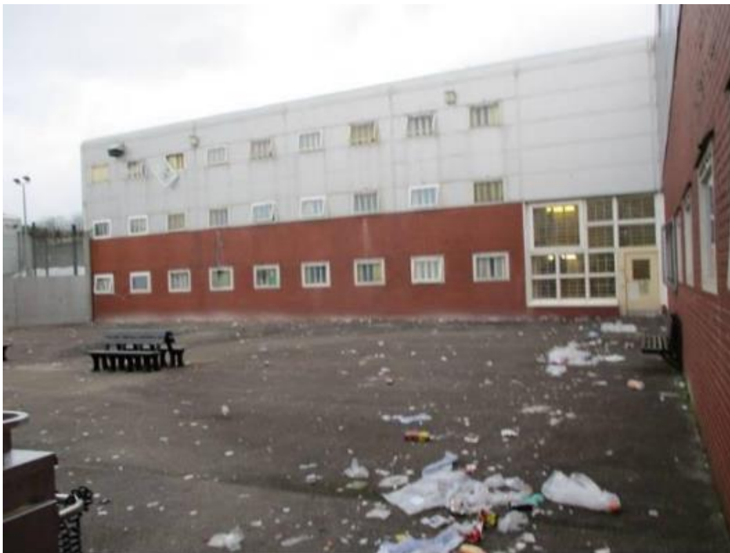
Iard ymarfer corff uned B